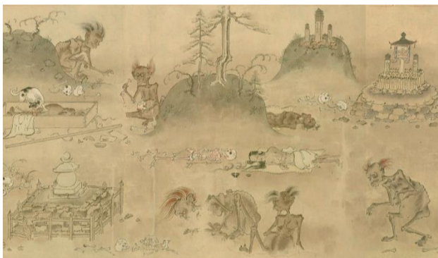
『餓鬼草子』(国宝) 東京国立博物館 養和の飢饉をモデルに描かれていると伝えられている。